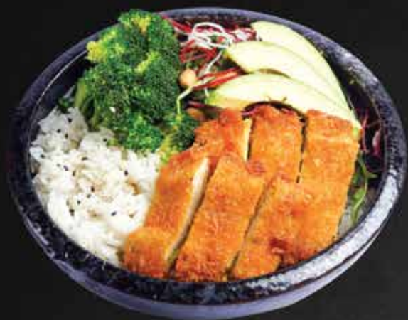
143. Chicken Bowl A,N 12,9

Knuspriges Hähnchen auf Reis, Kräutersalat, Gurken, Avocado, Erdnüssen, hausgemachte Soße/ crunchy chicken on rice, herb salad, cucumbers, avocado, peanuts, homemade sauce