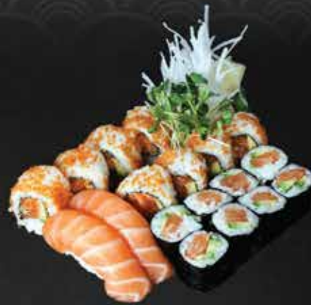
235. Salmon Set D 14,9

2 Tofu Nigiri, 8 Avocado Maki, 8 Veggi I-O