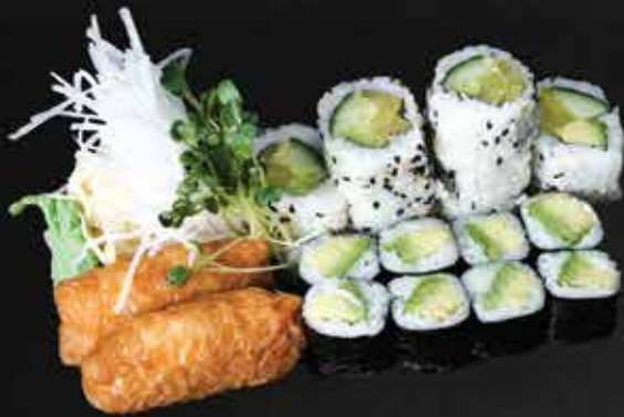
232. Veggi Set N 14,5

2 Tofu Nigiri, 8 Avocado Maki, 8 Veggi I-O