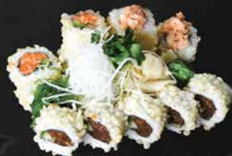
237. Crunchy Set B.C.D.N 13,5

2 Tuna Nigiri, 8 Tekka Avocado Maki, 6 Tuna Tempura Roll