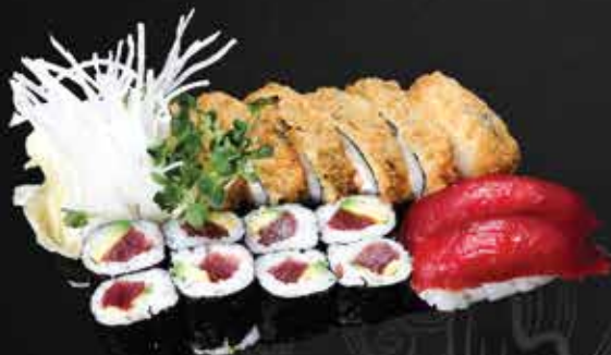
234. Tuna Set A.D.N 15,9

2 Ebi Nigiri, 8 Ebi Avocado Maki, 8 Crunchy Ebi