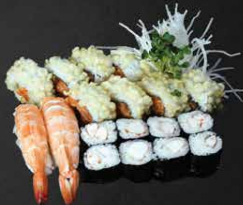
236. Ebi Set A.B.N 16,5

2 Ebi Nigiri, 8 Ebi Avocado Maki, 8 Crunchy Ebi