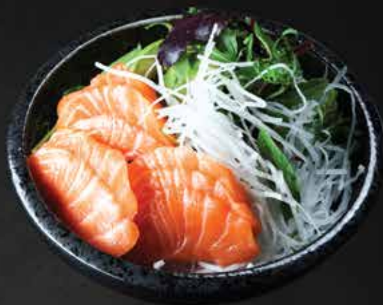
145. Poke Bowl D,N,F 15,9

Knuspriges Hähnchen auf Reis, Kräutersalat, Gurken, Avocado, Erdnüssen, hausgemachte Soße/ crunchy chicken on rice, herb salad, cucumbers, avocado, peanuts, homemade sauce