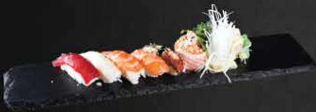
233. Nigiri Set A.C.D.R.N 14,9

2 Sake Nigiri, 8 Sake Avocado Maki, 8 Sake I-O